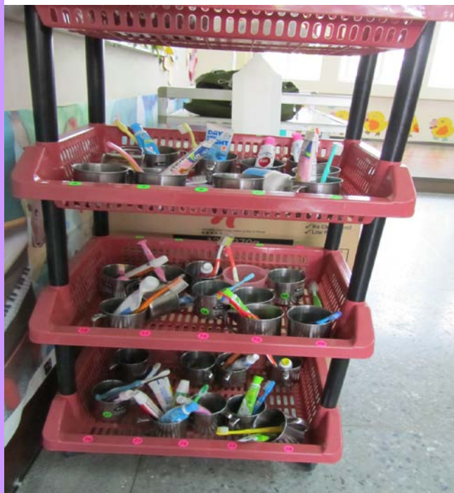
班級牙刷用具擺放整齊